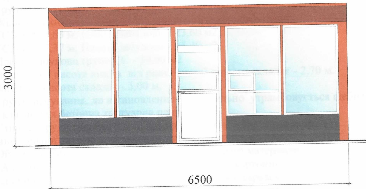
Бічний фасад ТС М 1:50